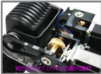
新方式スプリングによる確かな動作