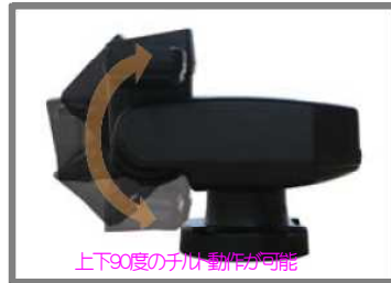
上下90度のチルト動作が可能