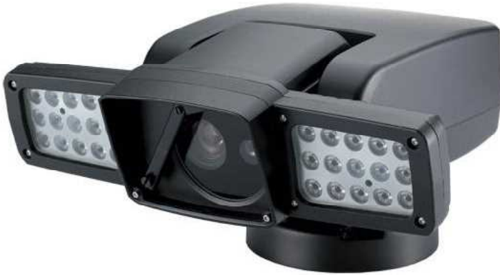
SUPER IR LED x 30/200m 照射